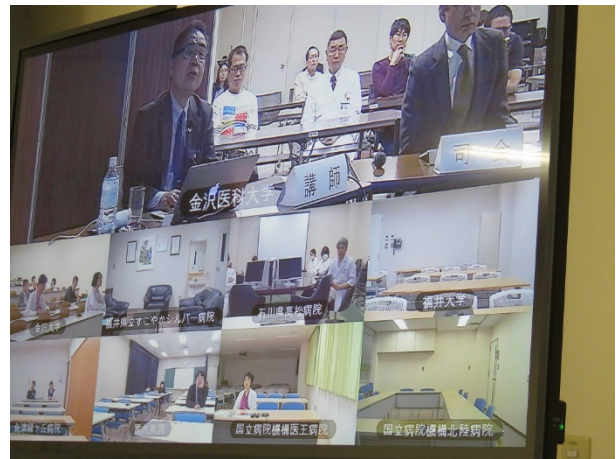
各施設会場の様子