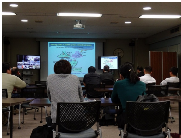
金沢医科大学会場の様子