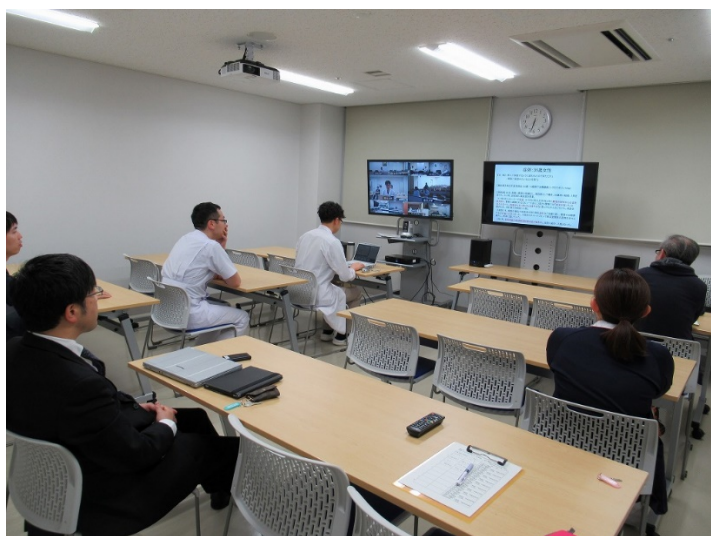
福井大会場の様子