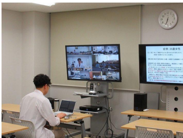
症例報告（福井大学）の様子

「若年発症の前頭側頭型認知症が疑われたクッシング症候群の一例」のタイトルで、福井大学からの症例報告が進められ、活発に質疑応答が行われました。