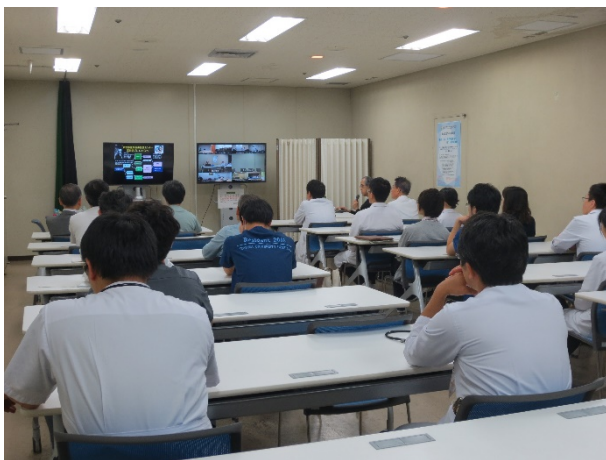
富山大学会場の様子