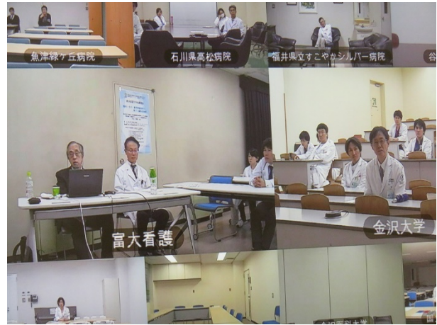
各施設会場の様子