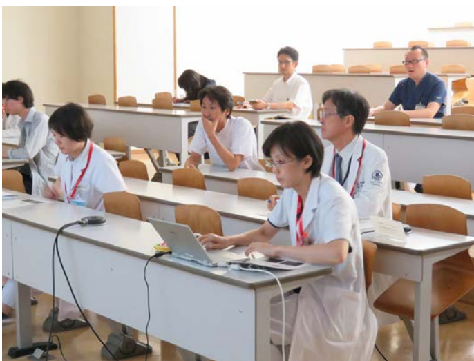
症例発表の様子（金沢大学会場）

「失語で発症した抗NMDA受容体脳炎の1例」のタイトルで、金沢大学からの症例報告が進められ、各大学、病院間で活発に質疑応答や意見交換が行われました。