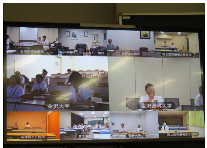
各大学・施設の様子