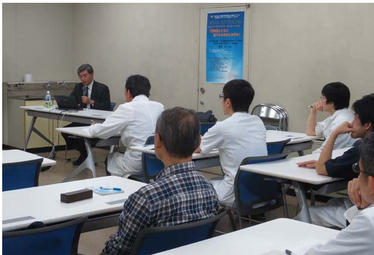
富山大学会場の様子