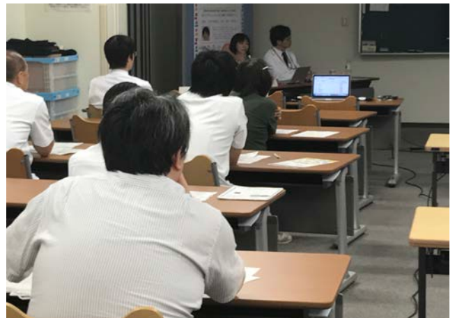
会場の様子：金沢大学