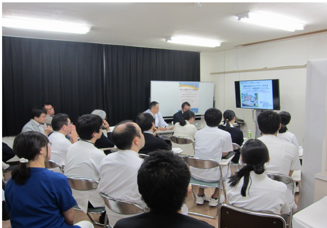
福井大学会場の様子