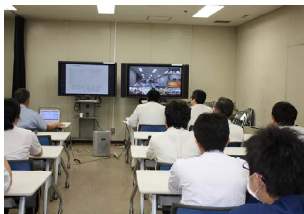
富山大学会場の様子