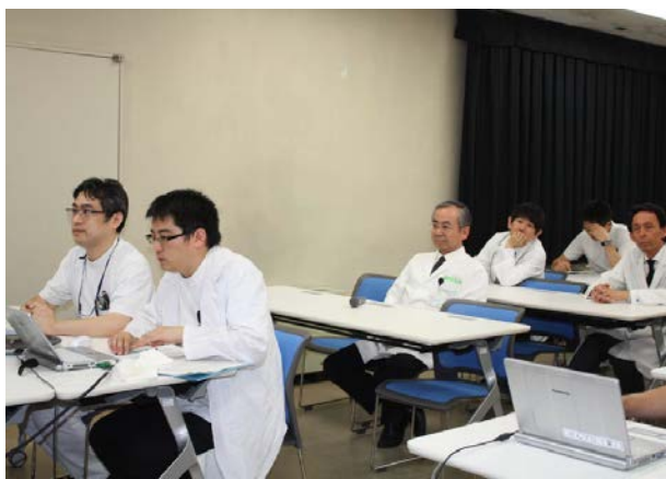
富山大学からの症例報告の様子

「認知症機能低下が亜急性に進行した若年男性例」のタイトルで、富山大学 神経内科からの症例報告が進められ、第15回目のデメンシアカンファレンスは、富山大学と各施設間で活発に質疑応答や意見交換が行われました。