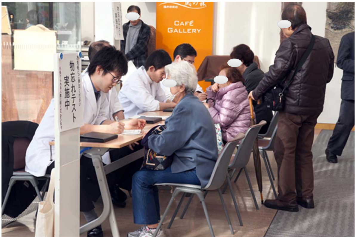
開演前 「もの忘れテスト」体験の様子