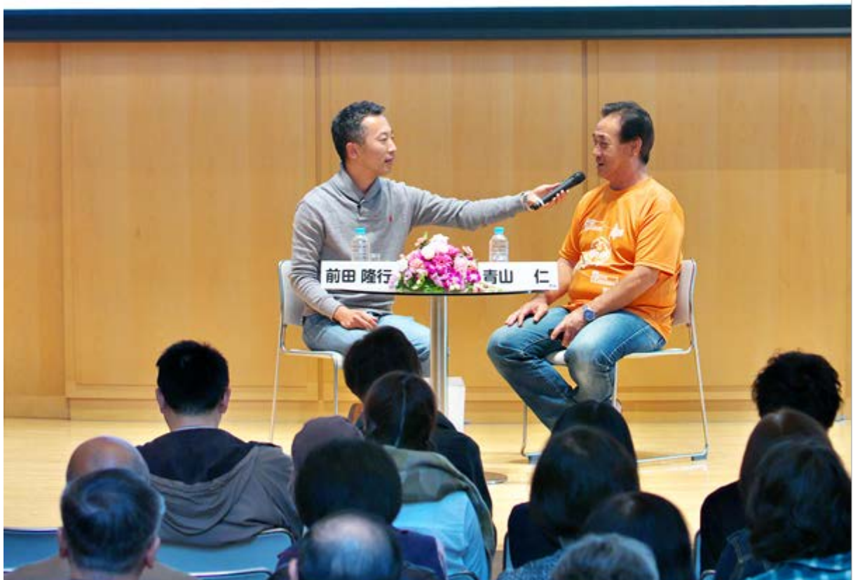
第1部 講演「青山さんと認知症とBLG! =生きる。」