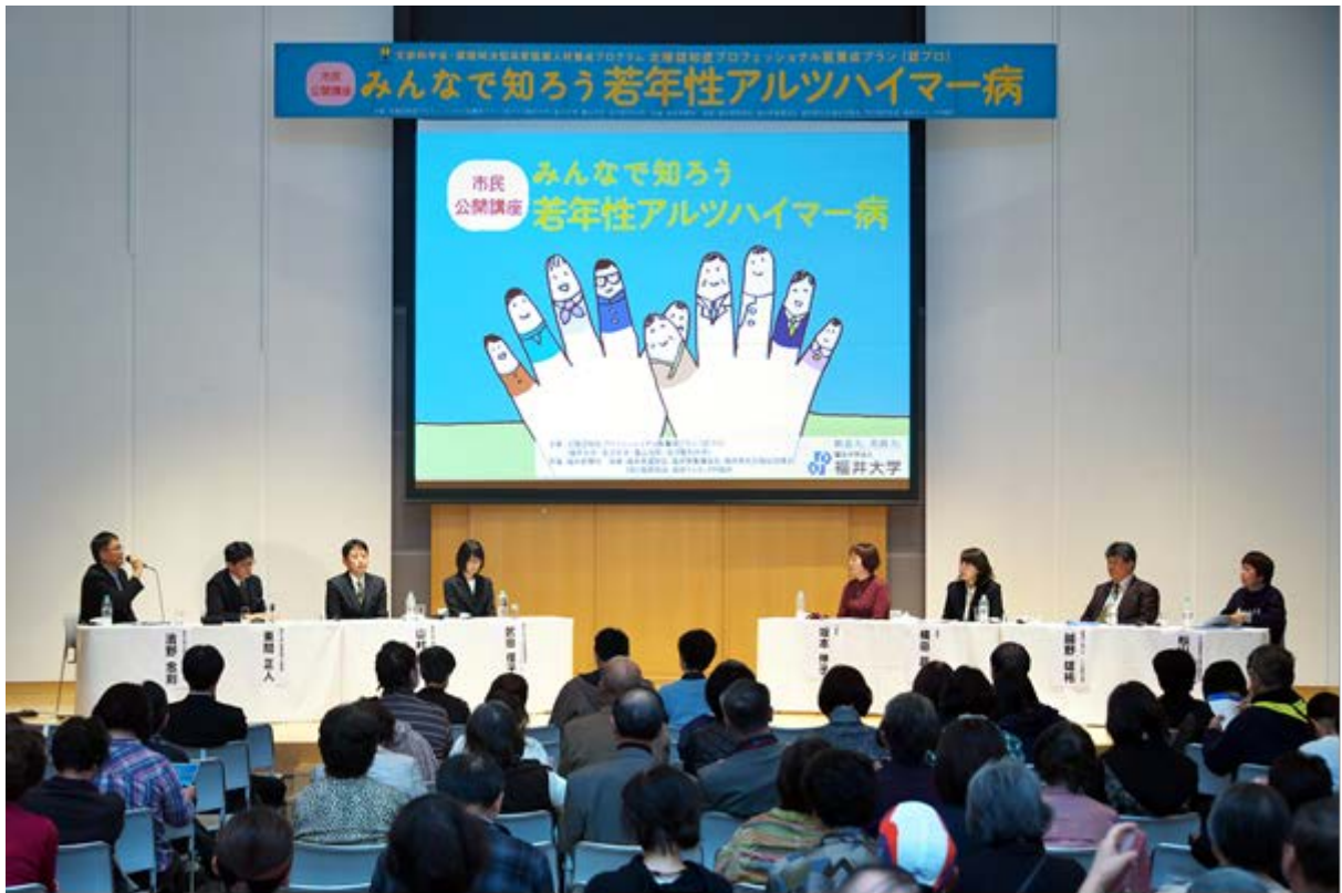
第2部 パネルディスカッション「若年性アルツハイマー病介護の現状」