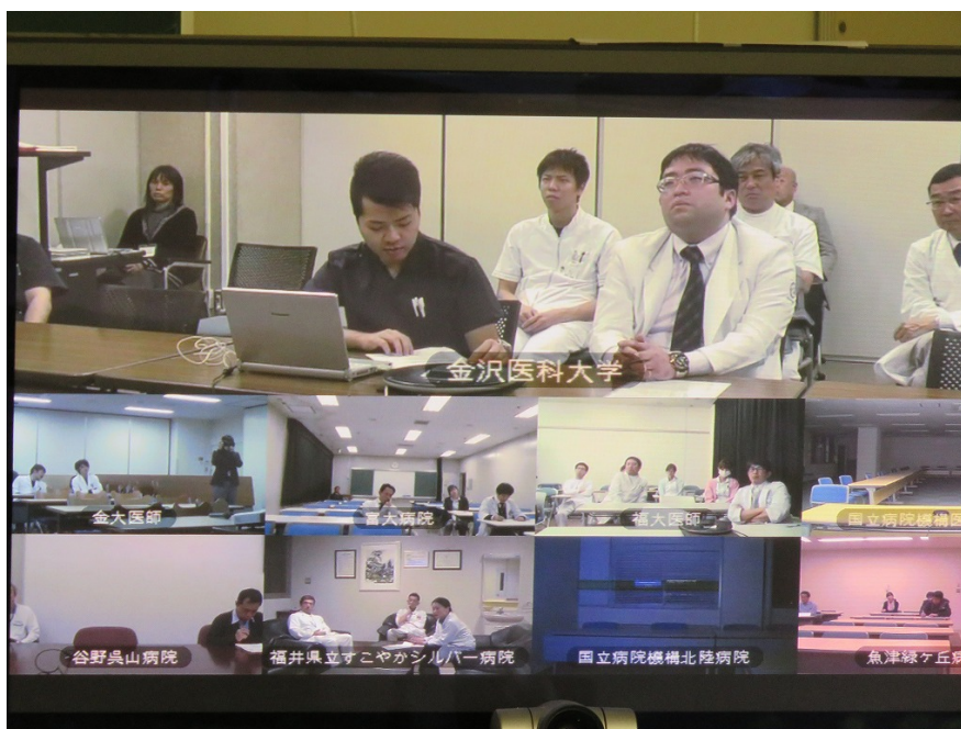
テレビ会議システムによる各会場間の質疑応答の様子