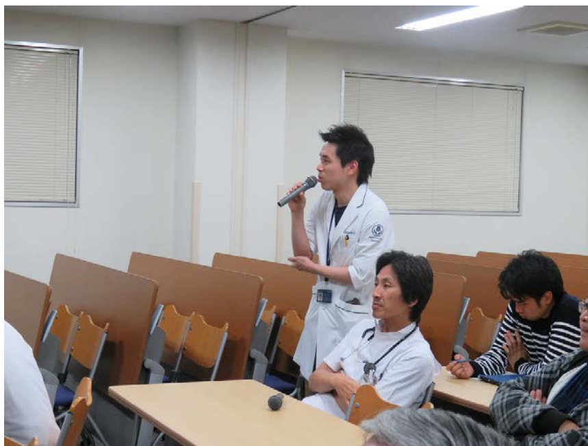
テレビ会議システムによる各会場間の質疑応答の様子