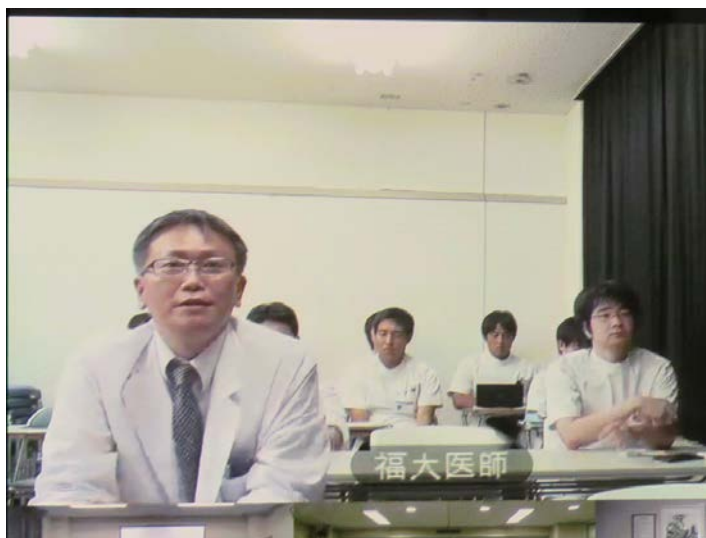
テレビ会議システムによる各会場間の質疑応答の様子