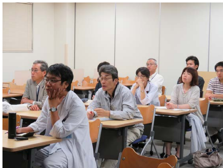
金沢大学会場の様子