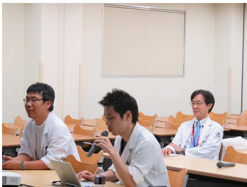
金沢大学からの症例報告の様子(金沢大学会場)

「近時記憶障害で発症した家族歴のある認知症の一例」のタイトルで、金沢大学神経内科からの症例報告が進められ、今回は類似症例として独立行政法人国立病院機構医王病院からも追加報告されました。第5回目のデメンシアカンファレンスは、金沢大学および独立行政法人国立病院機構医王病院と各施設間で活発に意見交換が行われました。