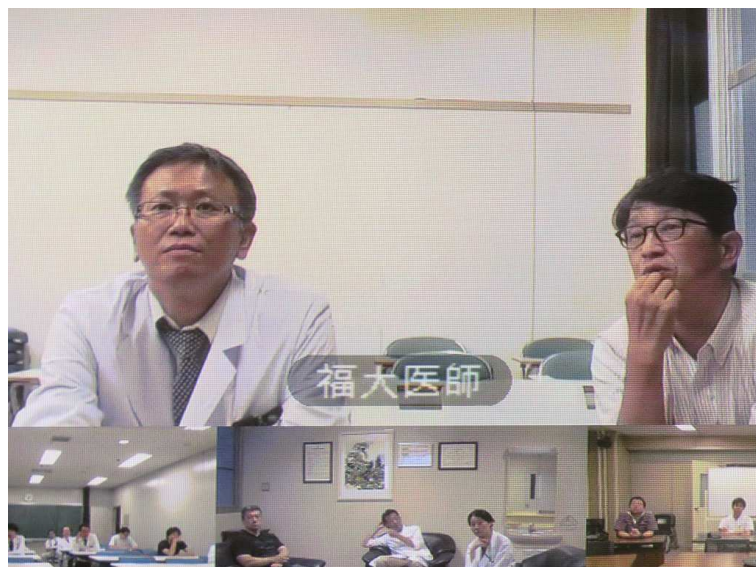
テレビ会議システムによる各会場間の意見交換